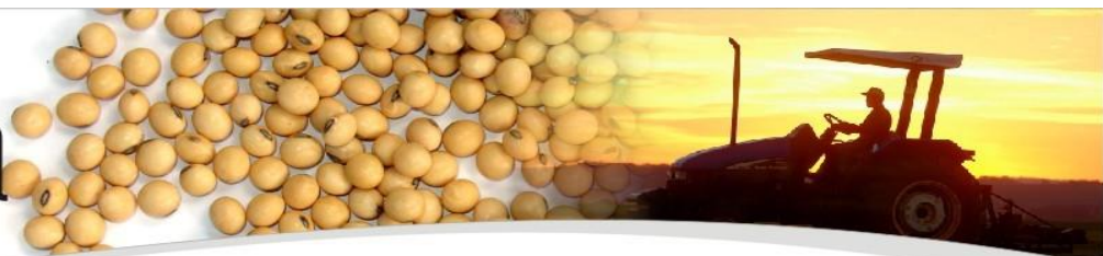
Evolução dos preços de soja, milho e trigo recebidos pelos produtores paranaenses de outubro de 2015 a outubro de 2016.