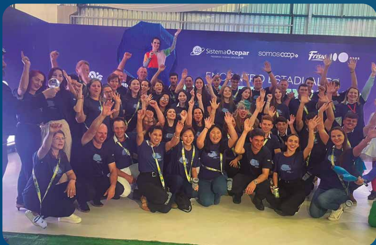
Cooperativa Lar Medianeira-PR