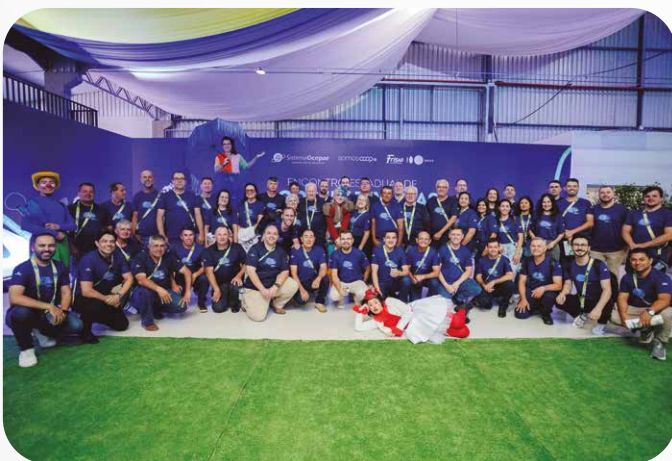
Sicredi Vale do Piquiri