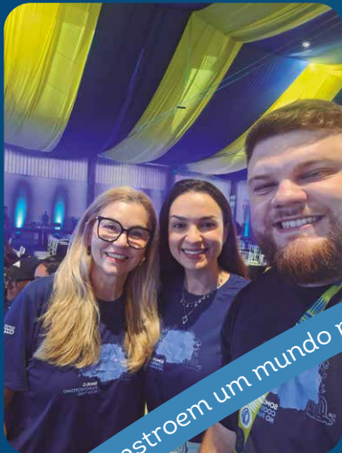
Sicredi Parapanema Serrana/SP