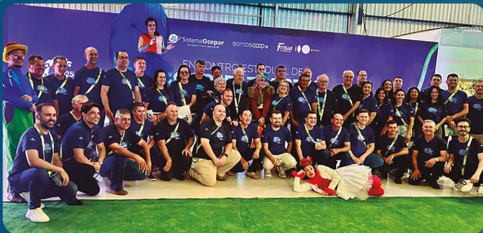
Sicredi Vale do Piquiri

melhor • cooperativas constroem um mundo melhor • cooperativas constroem um mundo melhor • cooperativas constroem um mundo melhor