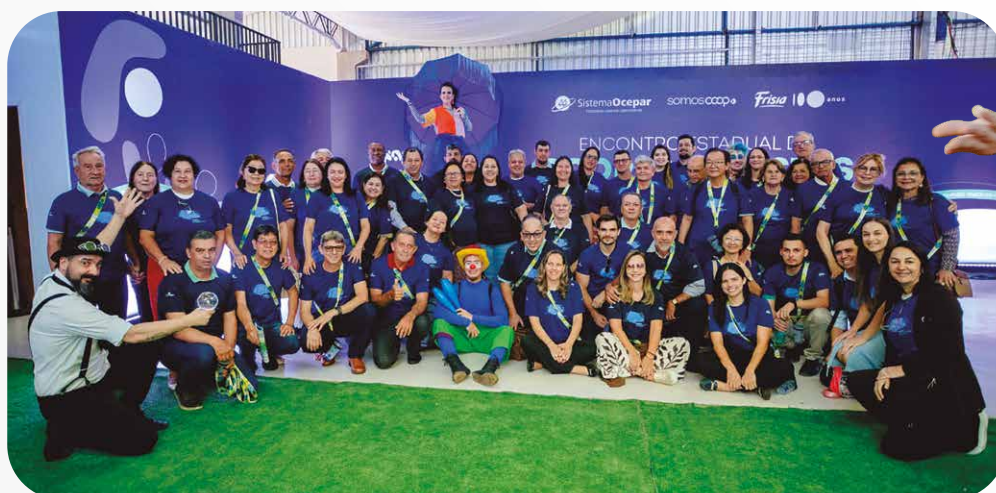
Sicredi Rio Paraná