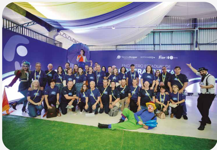
Sicredi Vanguarda PR/SP/RJ