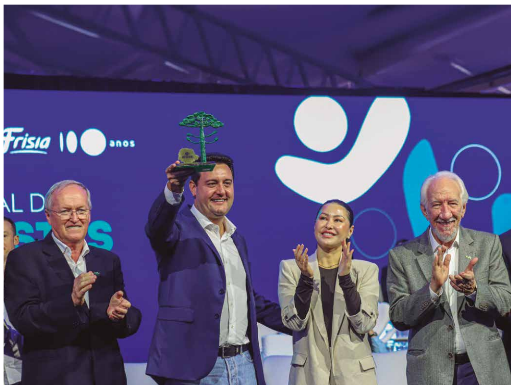
Presidente da Ocepar, governador do Paraná, primeira-dama e vice-governador

"Como homem público, hoje reconhecido por todas as cooperativas do estado, fiquei muito feliz. Especialmente por saber que foi por unanimidade", disse Ratinho Junior. "Sabemos que essa votação é muito criteriosa e feita com muita seriedade, por isso me dá muito orgulho", frisou.