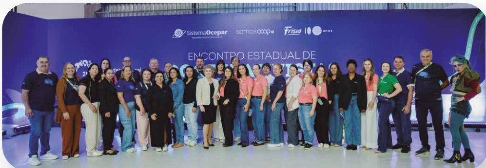
Sicredi Nossa Terra