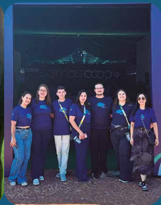
Unimed Ponta Grossa