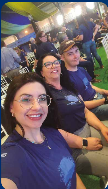
Colégio Cooperativa Lapa