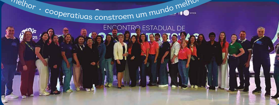
Sicredi Nossa Terra