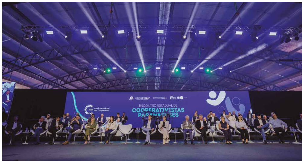
Autoridades prestigiam Encontro Estadual de Cooperativistas