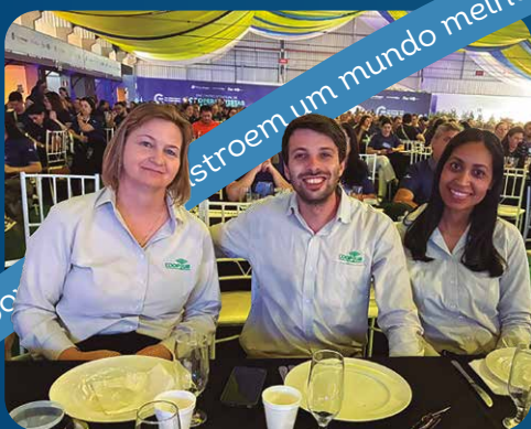
Cooptur Ponta Grossa