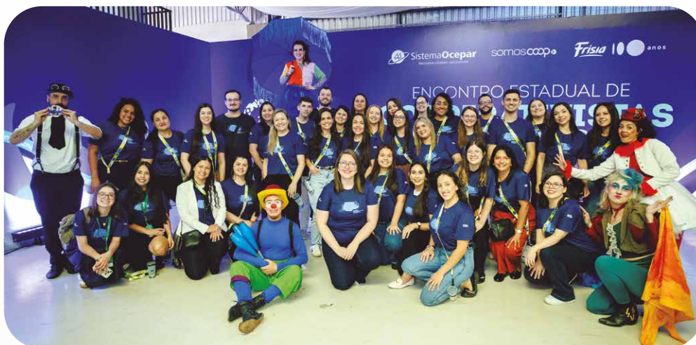
Unimed Ponta Grossa