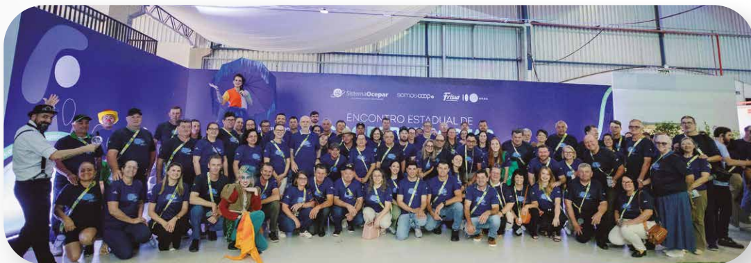
Sicredi Fronteiras PR/SC/SP