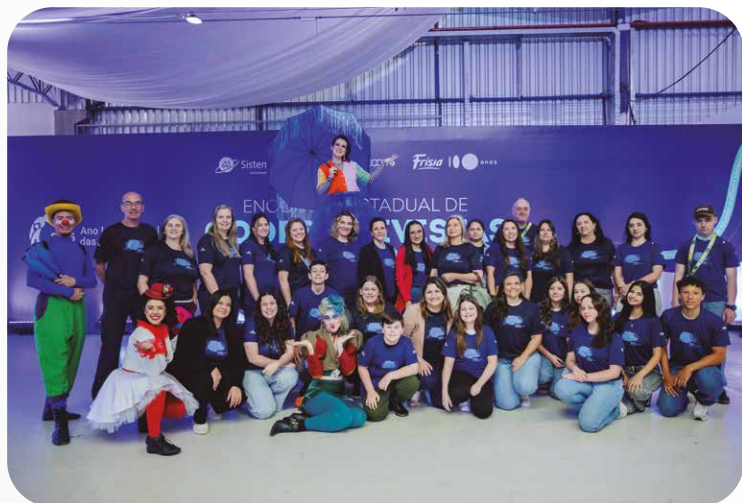
Colégio Cooperativa da Lapa