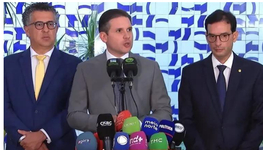
Imagem: Dep. Alencar Santana (PT/SP), Dep. Hugo Motta (Republicanos/PB) e Dep. Leo Prates (Republicanos/BA).

Os Sistemas OCB e Ocepar seguem acompanhando a tramitação da matéria e realizando discussões acerca do impacto da proposta no setor cooperativista , defendendo a importância de um debate amplo e responsável sobre a temática .